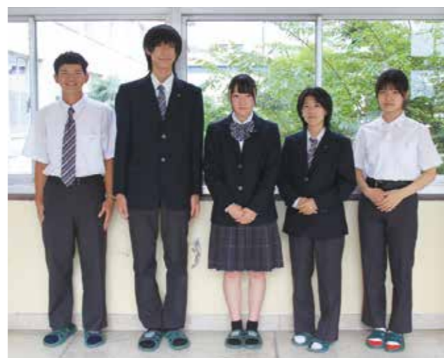
写真は本校の標準服です

学校見学会および学校説明会の詳細や申込方法については、各会の約1か月前にホームページにアップしますのでご覧ください。