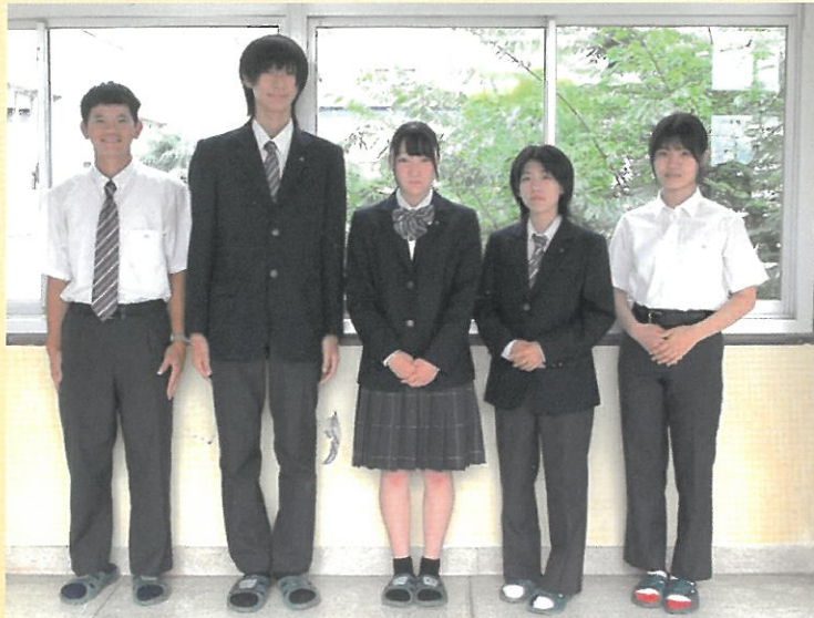
写真は標準服(制服)の冬服と夏服です。